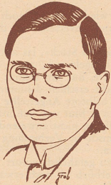
Weltmeister Dr. M. Euwe

Allgemein war man der Ansicht, daß die Siegerfrage in diesem doppelrunden Turnier nur zwischen Dr. Euwe und Dr. Aljehin entschieden werde, während Bogoljubow und Sämisch bestenfalls einige Achtungserfolge erzielen könnten. Der 1. Spielgang verstärkte diese Meinung. Euwe führte mit 2 1/2 Punkten aus 3 Partien, wobei besonders sein Sieg über Aljehin zu erwähnen ist. Bogoljubow blieb mit 1/2 Zähler Letzter. Der 2. Spielgang wirkte geradezu sensationell: Bogoljubow schlug alle 3 Konkurrenten in bestem Stil. Euwe und Aljehin erreichten nur noch 3/2, während Sämisch, in Zeitnot Gewinnaussichten verderbend, gänzlich versagte. Die Überraschung in diesem Kampfe war zweifellos Bogoljubow, dessen kraftvolles Spiel an die besten Tage seiner Glanzzeit erinnerte.