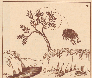
Und wie's ein gewitzter Igel machte, um mit seinen kurzen Beinen über einen tiefen Bach zu gelangen.