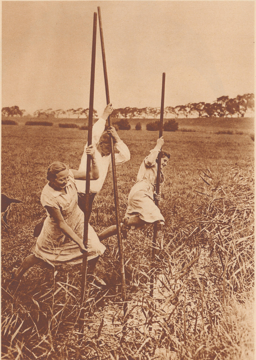
Wenn die Mägde und Bauern nach dem Vieh sehen, das den ganzen Sommer über draußen auf der freien Marsch gras, benutzen sie ebenfalls die langen Stöcke. Mit denen springen sie eins, zwei, drei über die oft ziemlich breiten Wassergräben in Friesland.