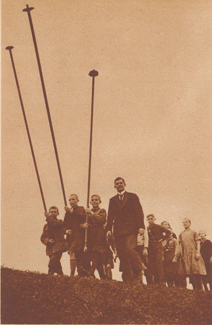
So sieht ein Schulausflug oben in Friesland aus. Jede Klasse nimmt ihre «Pullstöcke» mit, lange Stangen, oft länger als 3 Meter, um damit die vielen Gräben und Kanäle zu überspringen.