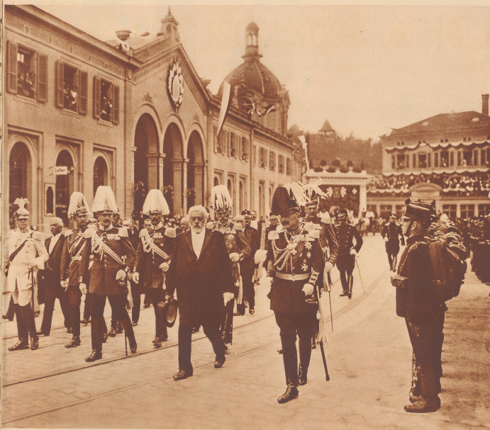
Kaiser Wilhelm in Bern, Freitag, den 6. September besuchte Wilhelm II. die Bundesstadt. 2 Uhr 30 nachmittag trat er von Zürich kommend in Bern ein. Unser Bild zeigt das Abschieden der Ehrenkompagnie auf dem Berner Bahnhofplatz. Man erkennt von rechts nach links: den Kaiser mit dem Marschallstab in der rechten erhabenen Hand; hinter ihm Graf von Moltke, der deutsche Generalleutnant; Bundespräsident Forrer; hinter ihm Generalmajor von Pfauen; weiter nach links General Graf Waldberg; General von Linker, Chef des kaiserlichen Militärstabes; General von Fries, Kommandeur des XIV. Armeekorps in Müllhausen; Bundesrat Müller und Fiere von Frenenberg (in weißer Uniform); ganz links rechts Legationsschauspieler, der gepanzerte Schweizer Gesandte in Bern. Zu diesem Bilde wurde der Photograph noch folgende besondere Bemerkungen: Die Abschiedsmärsche waren in Bern noch rigoros als in Zürich. Die Anzüge der Berner Bahnhöfe waren mit hohen Bretterwänden überzogen, so daß kein Unbefugter auf dem Empfang des Kaisers überhört werden konnte. Aber Hindernisse sind da, um überwinden zu werden, und so klammerte sich ein mit Hilfe eines Wirtschaffens und eines Stuhles über die vier Meter hohe Wand, um in einem militärischen Doppelportale in die Arme zu springen. Sofort wurde sich dem Platzkommandanten Oberst Wälchli vorgetrieben, der aber ohne Erfolg. Hätte wie Verändertes für die Lage des Bahnhofsportales besetzt und den Delinquenten nach im Verließ durch einen Offizier auf das Trottoir vor der Heiliggeistkirche führen ließ, der gegenüber die Ehrenkompagnie aufstellung genommen hätte, so kann sich zu der eintretenden Aufnahmewie der Kaiser mit seinem Gefolge die Ehrenkompagnie abschiedete, ein Bild das ein unvergessliches Zeitdokument bietet.