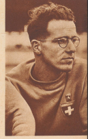
Der Berliner Bibikowa, Sieger im Zehnkampf. Zwischen ihm und dem Russen Jasin kam es zu einem erbitterten Endkampf, aus dem der Schweizer mit 6299 Punkten als Sieger hervorging, während der Russe mit 5973 Punkten nur mit dem zweiten Platz begnügen musste. Le Berinois Bibikowa, qui avec un total de 6299 points remporta le décathlon devant le Russe Jasin, 5973 points.