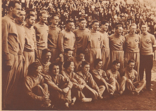
Die Schweizer Team-Delegation. — La délégation suisse.