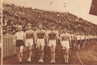
Einmarsch der ausländischen Athleten im Stadion von Antwerpen, an deren Spitze indische Turner. Von zwanzig Ländern waren rund 25000 Sportler zur III. Arbeiter-Olympiade nach Antwerpen gekommen. Entrée des délégations dans le stade d'Anvers. 25 000 sportifs représentant 20 pays participent aux Jeux de la IIIe Olympiade ouvrière.