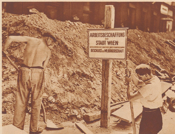
Arbeitsbeschaffung auf der Großstadt-Straße

Die Tafel Arbeitsbeschaffung findet man z. B. in Wien auch oft bei kleinen Straßenarbeiten. Aber man darf nicht vergessen, daß der gute Wille hier wohl an zu vielen Stellen eingreifen muß, als daß er immer mit Maximalleistungen paradien könnte.