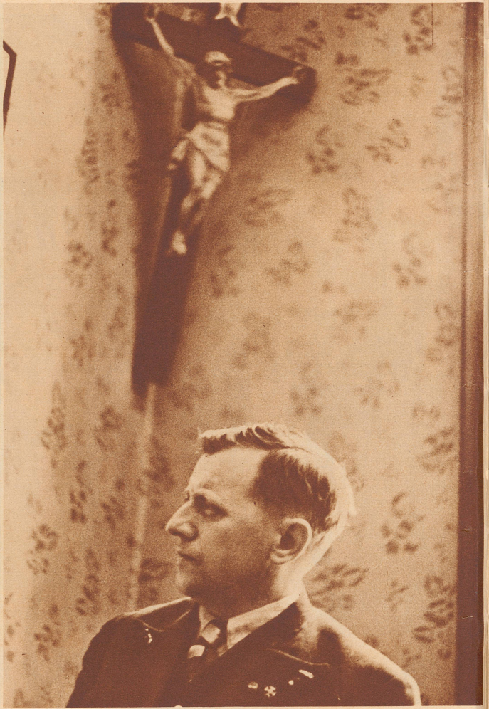
Das Kruzifix in jedem Amtszimmer

Il y a une quinzaine d'années s'élevait sur ces lieux une fabrique qui employait 400 ouvriers. Cette fabrique fut démolie. Récemment des enfants découvrirent du fer sur cet emplacement. Aussitôt des chômeurs entreprirent de creuser le sol et de mettre à jour des câbles, tuyaux, etc., qu'ils revendirent comme vieux fers pour 5 centimes le kilo. Vienne compte actuellement 163 000 chômeurs.