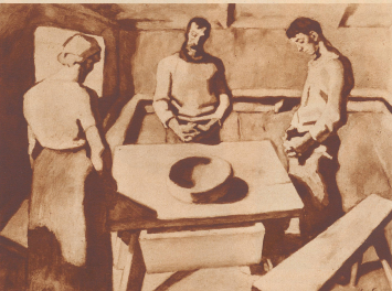
Albin Egger-Lienz (1884-1910): Die Tischgebet. (Aus der Ausstellung in der Berner Kunsthalle «Oesterreichische Malerei und Plastik im 20. Jahrhundert».)