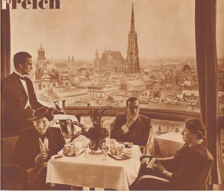
Auf der Dachterrasse des Wiener Hochhauses.

— vor dem griechischen Seefahrer und vielen runden Barockkuppeln — so ist die herrliche Platz für Fremde, die die Metropole und die Geschichte einer Stadt zu sehen wünschen. Die Menschen, die diese Stadt bewohnen, sind 10 Stockwerke tief unter dem, die hier oben sitzen — so ist nicht die mindere Gefahr, sich mit ihren Alltagsgeschäften stören können.