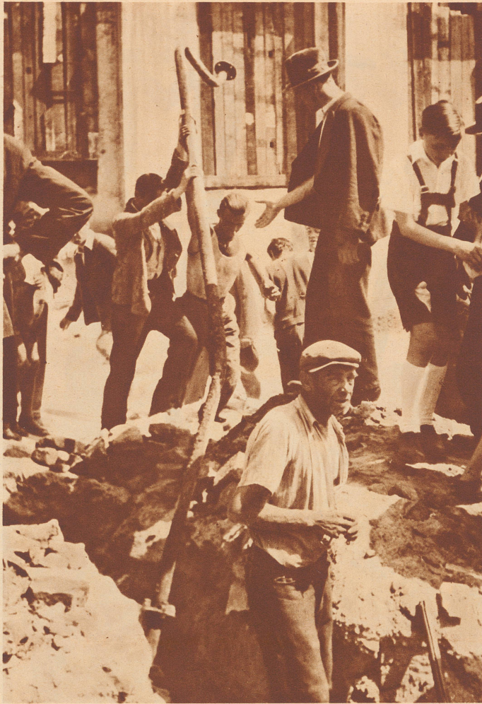
Arbeitslose graben Eisen