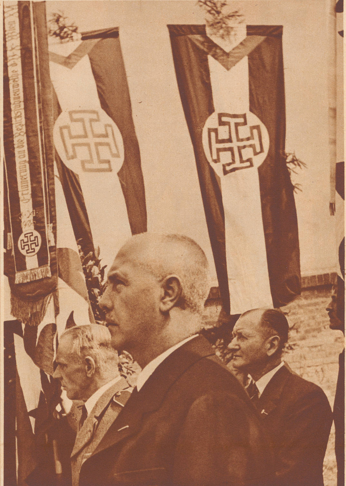
Funktionäre der Vaterländischen Front

Le port de bas blancs avec le costume national, tel était le moyen camouflé de montrer jadis ses sympathies nationales-socialistes. «Similia similibus currantur», disent les homéopathes, les jeunes du Front patriotique portent actuellement aussi le costume national et des bas blancs.