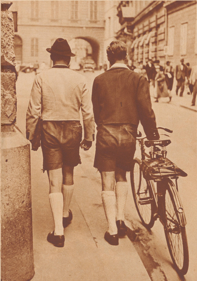
Strümpfe, leicht politisch gefärbt