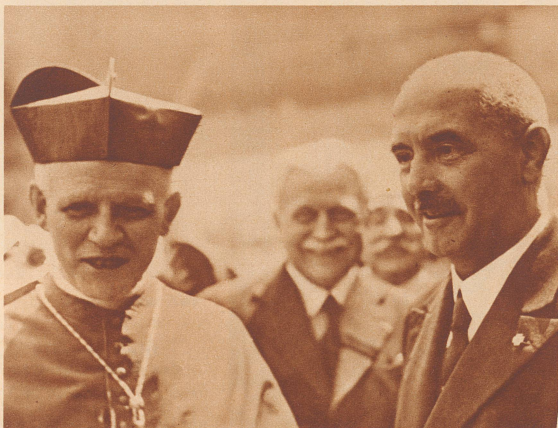
Zwei Stützen des neuen Staates

Fonctionnaires assistant à une fête du Front patriotique. Le Front patriotique dont l'emblème, la croix potencie, orne le centre du drapeau autrichien est en somme toutes proportions gardées l'équivalent du parti national-socialiste en Allemagne. Tous les groupements économiques, quelles que soient leurs tendances politiques en ressortent. Le Chancelier d'Etat en est le chef suprême. C'est lui ou ses représentants directs qui procèdent aux nominations des fonctionnaires. Le but principal du Front patriotique est l'indépendance politique, économique et sociale de l'Autriche sur les bases d'un Etat chrétien.