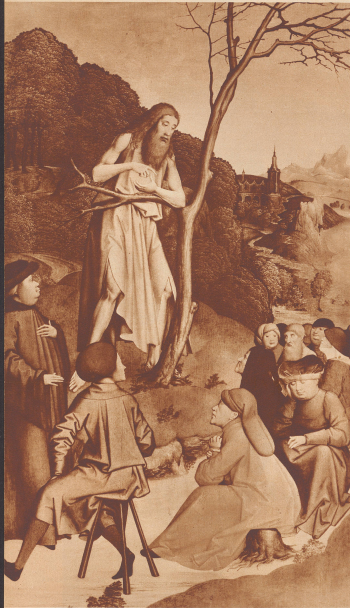
Baselard Forster v. J. (1897) (Bilder von Pausan): Die Predigt Johanns. (Aus der Ausstellung im Zürcher Kunsthause «Oesterreichische Kunst (Gothik, Barock, Biedermeier)».)