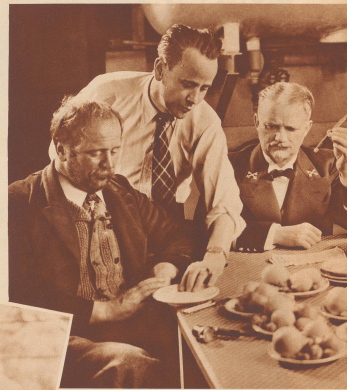
Der Regisseur und zwei Hauptdarsteller

On a beaucoup discuté de la question du cinéma suisse. Des vœux se sont disputés l'honneur de devenir le Hollywood helvétique et l'auteur tombe dans le lac. Vingt de nos compatriotes ont agi, agi sans réclamer l'apogée, et tourné le film «Petite Schindlögler» dans le cadre des Alpes bernoises, film qui passera probablement sur nos écrans. Cette première bande, que le public ne mangera pas d'accueillir avec intérêt, donnera peut-être un répit essor à une production cinématographique suisse.