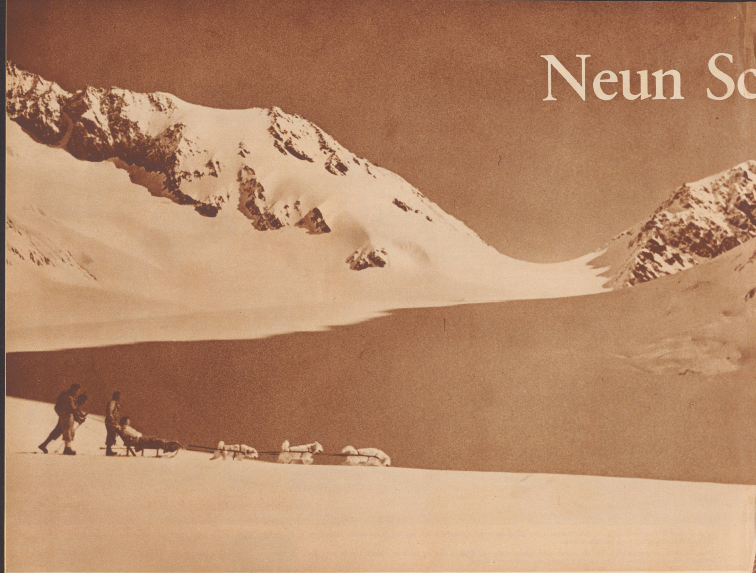
Auf dem Wege zur Filmarbeit im Hochgebirge

Zu den Dreharbeiten gehören auch die Polkumane, die hier die Hauptdarsteller und ihren Schützen über das Alpengebirge zur Konkordiamündung führen. En route pour les studios en haute montagne. Le réalisateur, assisté de deux polaires, de l'acteur principale traverse le glacier d'Aléou en direction de la cabane Concordia.