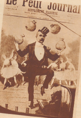
Des français français révolutionnaires gélois die «Entente cordiale» qui nicht, Sie England und republikanischer Kaiser-Büro, Clemenceau, zu beschuldigen, er habe sich von England betrogen lassen. Die Kaiserin erregt ihn, wie er nach dem Mord seiner eigenen Geliebten stand und mit Geliebten voll englischer Freundschaft jongliert.

Français débarquaient à Tunis (1881). Quelques années plus tard (1891), le célèbre incident de Fashoda faillit dégrader en conflit armé. Mais le colonel Marchand était homme de grand bon sens et Edward VII défendit la France. Ce sacrifice qui, outrepassant son rôle de monarque constitutionnel, commença volontairement dans la politique étrangère de son pays, fut avec le Président Loubet le véritable artisan de l'Entente cordiale. Les deux puissances trouveront un terrain d'accord à l'amiable. La France consentit à un intérêt vital en Egypte et l'Angleterre laissa la France libre d'agir au Maroc. Ce pays venait alors dans une perpétuelle agitation, les troupes françaises y débarquaient en 1904 pour rétablir l'ordre. Au nom du principe de l'indépendance marocaine, Guillaume II se rendit alors personnellement à un congrès (1905) et promouva, sans lui en avoir, un accord irrévocable. L'Angleterre soutint fermement son allié en cette attitude (sans révéler l'alliance). L'accord définitif fut convoqué la conférence d'Algésiras (1906) dans l'enceinte de la ville, sous le patronage national de la France et l'Espagne, le droit d'y participer fut refusé.