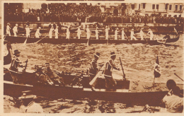
Kaiser Wilhelm II. und König Viktor Emanuel III. auf dem Canal Grande in Venedig am 25. März 1900. Demmal legte Deutschland großen Wert auf Italien. Zugleich war es ein wichtiger Faktor in Italien. Dreibund-Politik, die in ihrer Sympathie für Deutschland - ihre Mutter war eine sächsische Prinzessin - nie verlebte. Als die Generali einen Antritt zum Odeur für und Viktor Emanuel III. auf den Thron gelangte, verlor die Königin ihren Einfluss auf die Dreibund-Politik.