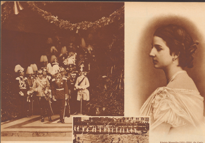
Kaiser Franz Joseph und der österreichische Thronfolger in Berlin. Ein Jahr nach Wilhelm II. Thronbesteigung besuchten Franz Joseph und Erzherzog Franz Ferdinand den deutschen Kaiser in Berlin (12.-15. August 1889). Jeder der beiden Kaiser trug die Uniform des ihm verbundenen Landes.