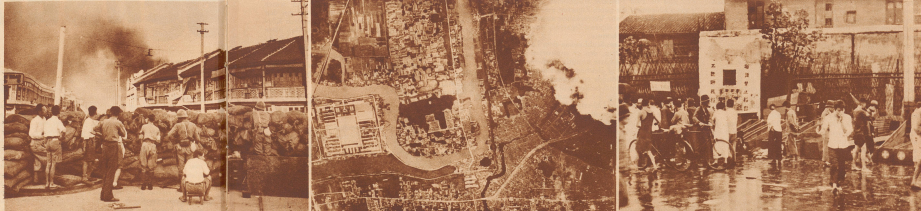
Japanische Stellung in einer Vorstadt von Shanghai. Die Barabarde befindet sich im Vordergrund. Ein improvisiertes Hotel mit dem japanischen Namen (links) steht rechts. Position japanische Armee in der Vorstadt von Shanghai. Les hommes sont à l'abri derrière une barrière de sacs de sable. Sur un petit fortin sont les 100 troupes.