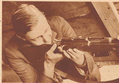
Der Schützenkönig im Anstand.