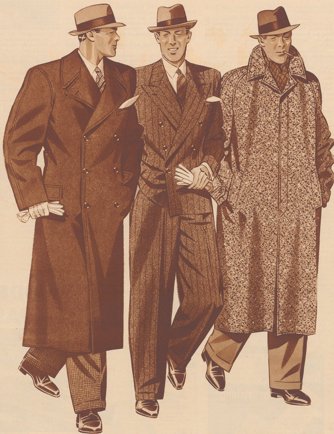
Dunkelblauer Ulster Fr. 120.-