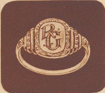
Fr. 5.— Damenring

griffen. Bei Nichtgefallen erhalten Sie Ihr Geld restlos zurück. Als Maß Papierstreifen schicken, satt um Fingerknochen messen. In 3-4 Tagen haben Sie den Ring per Nachnahme und Porto von OBRECHT, VERSANDHAUS, WIEDLISBACH a