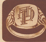
Fr. 9.— Herrenring