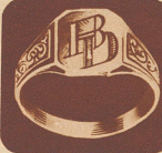
Fr. 6.— Herren und Damen

Jeder massiv Doublé mit starkem Goldmantel vergoldet. Ihr Monogramm wird von sicherer Hand eingraviert. Das ist im Preis inbe-