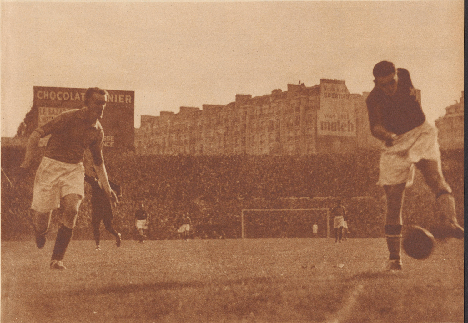
Fünfzigtausend Zuschauer im Parc des Princes. Eine graue Masse, sitzen sie da, kaum zu unterscheiden von den Felswänden des riesigen Häuserblocks im Hintergrund. Dazu die riesigen Plakatschriften, die Arena im Vordergrund: Sport unserer Zeit. Match France-Suisse, au Parc des Princes, à Paris: 2:1. 50 000 personnes assistèrent à cette compétition. Notre photo donne une idée de l'énorme affluence.