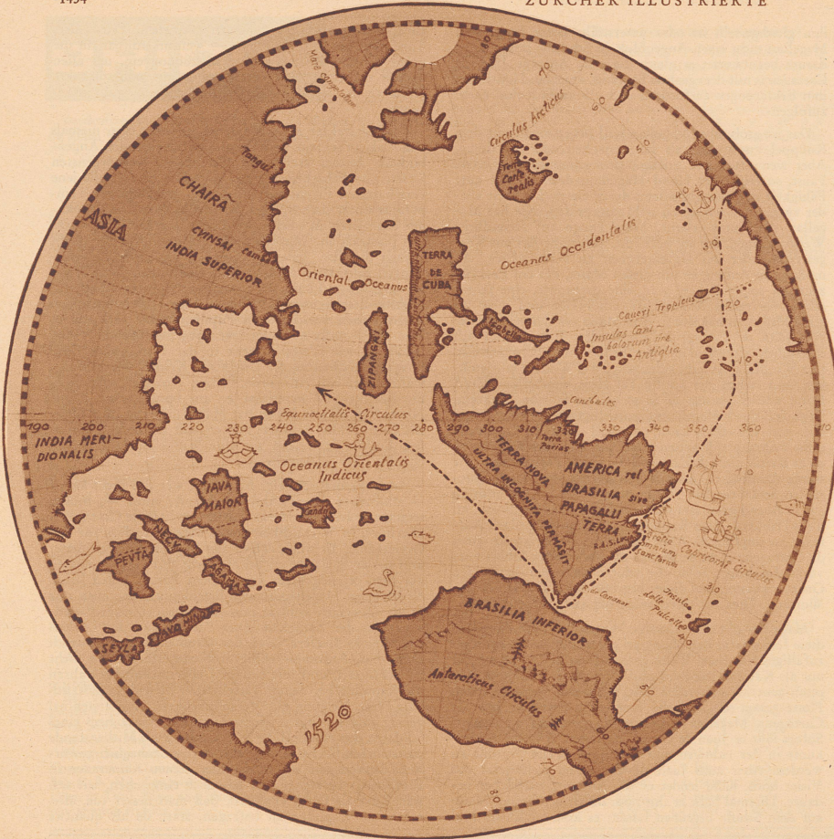
Das Kartenbild, das Magellan den Glauben an das Gelingen seiner Tat stärkte.