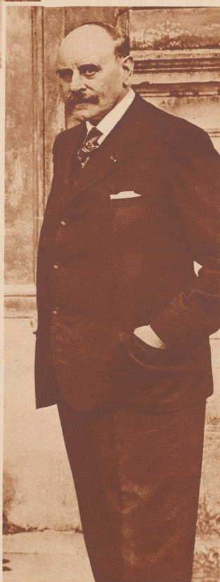
Staatsminister Graf Carton de Wiart

erklärt: «Die Regierungsmehrheit, die vor den Wahlen die katholisch-konservative Partei innehatte, wurde zugunsten der Sozialisten durch die Rexisten gesprengt. Die 21 Kammermitglieder dieser Fraktion wurden zu 80 % von katholischen Wählern gewählt. Das ist ganz und gar nicht erstaunlich! Unsere Partei setzt sich aus den mannigfaltigsten Volksgruppen zusammen. Die Verbitterten, die Kleinen, von der Krise heimgesuchten Rentner, die Unzufriedenen, die einfach «etwas anderes» wollen, schenken dem jungen, zungenfertigen, aber nicht immer sehr vertrauenswürdigen Degrelle ihr Vertrauen. Ich habe allen Grund zur Annahme, daß es heute anders wäre.»