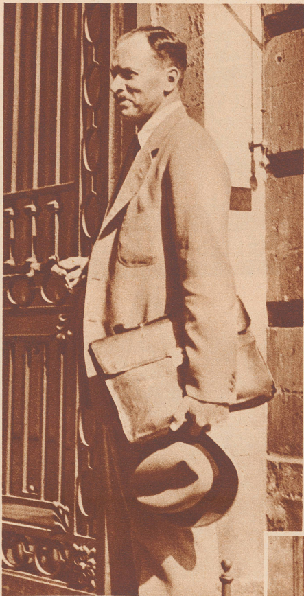
Finanzminister de Man

aus dem Kabinett van Zeeland, erklärt: «Die jüngste Erfahrung eines großen Nachbarlandes hat uns die Gefahren überreifer Reformen dargetan. Ein ähnliches Vorgehen würde unser Produktion und unser Wirtschaftsleben zugrunde richten. Man kann einen Plan nur nach und nach durchführen. Die gegenwärtigen Absichten des belgischen Sozialismus sind denjenigen des englischen und skandinavischen Sozialismus viel verwandter als denjenigen des französischen. Man nennt mich Marxist. Ich bin es wirklich ein bißchen aus Freude am Widerspruch. Auf jeden Fall aber bin ich überzeugt, daß für uns die konstitutionelle Monarchie die beste Regierungsform ist.»