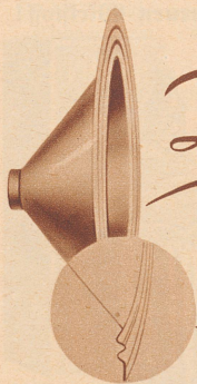
Die Ausprägung der Membranerke an der Breitbandmembran