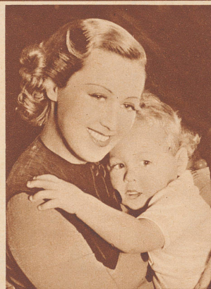
Joan Blondell and her Son Warner Brothers Star appearing in "The perfect Specimen"

IRIUM gibt Ihren Zähnen wieder strahlenden Glanz