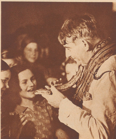
Aufnahmen von einer Schlangenvorführung in Adliswil von Gotthard Schuh