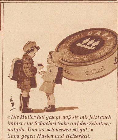
«Die Mutter hat gesagt, daß sie mir jetzt auch immer eine Schachtel Gaba auf den Schulweg mitgibt. Und sie schmecken so gut!» Gaba gegen Husten und Heiserkeit.