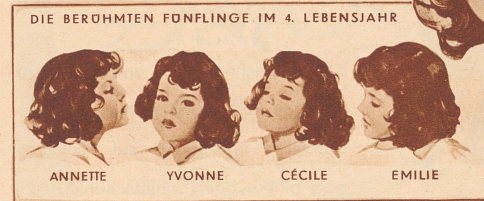
DIE BERÜHMTE FÜNFlinge IM 4. Lebensjahr

Mit einer beträchtlichen Menge dieses köstlichen Olivenöls hergestellt