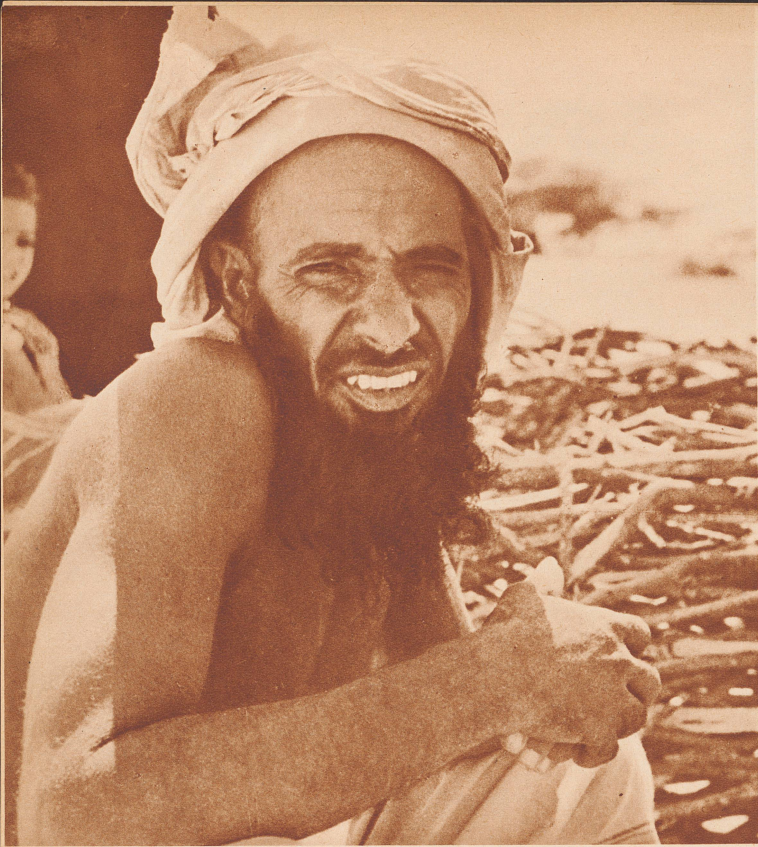
Karawanenführer aus Oman.

Die alten Karawanenführer gleichen in ihrer Verschlagenheit, mit ihren zusammengekniffenen Augen, die den Sonnenglanz meiden, alten Seekapitänen. Wie diese tragen sie eine große Verantwortung — sie haben im unruhigen Ostarabien die Karawane mit der Waffe zu verteidigen und wie diese kennen sie keine Heimat. Durch ihren Mund werden die Waffentaten arabischer Helden von Stadt zu Stadt getragen. An sie wenden sich die Kaufleute und Fürsten, die über einen fremden Wüstenstaat Bescheid erhalten wollen.