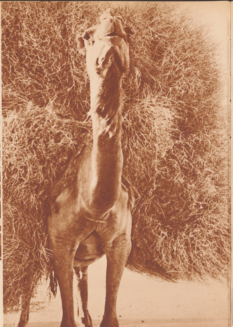
Das Leitkamel einer ostarabischen Karawane.

Carte de voyage de notre collaborateur. Parti de Bagdad, il y revint trois mois plus tard ayant couvert un trajet de 4700 kilomètres.