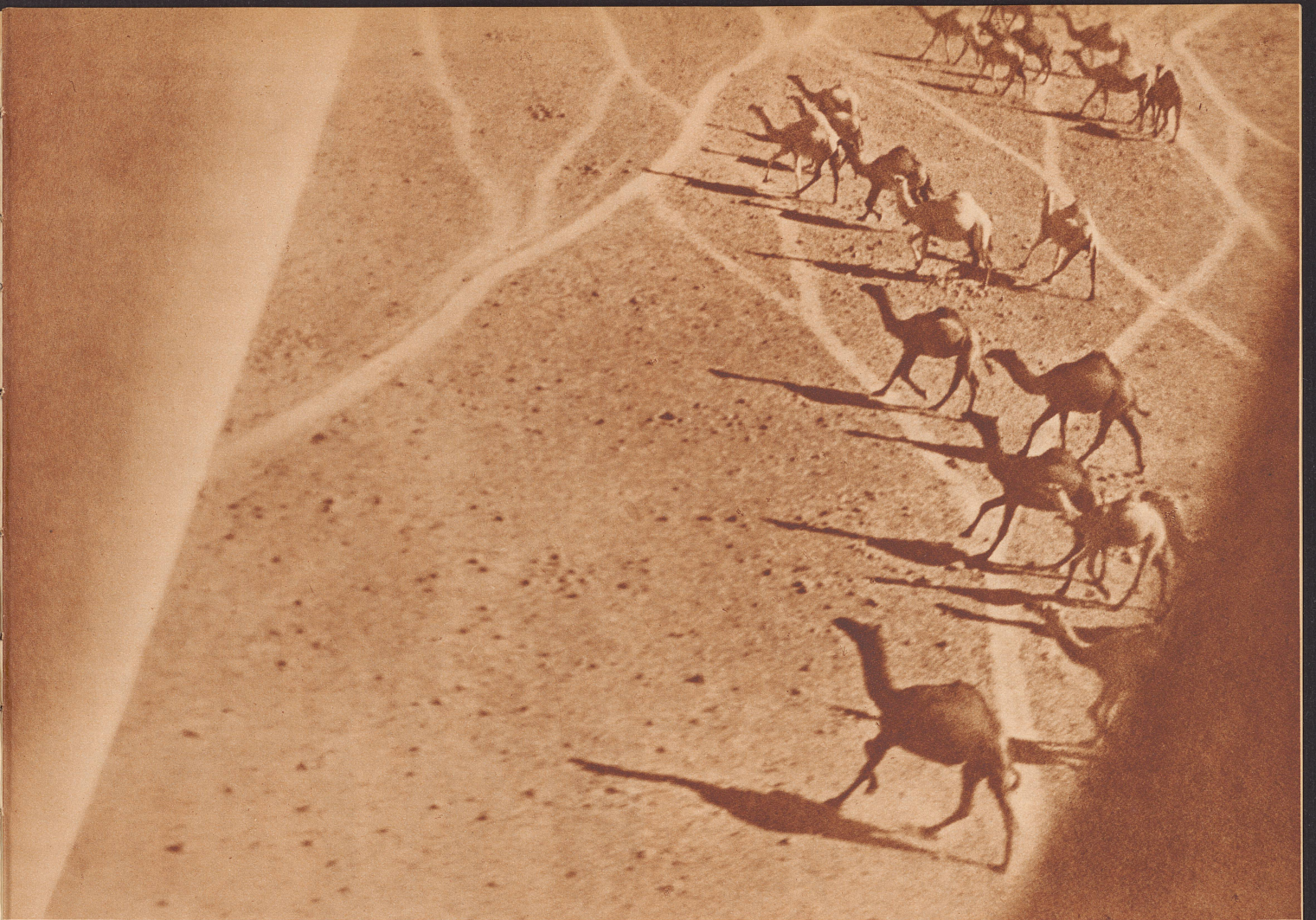
Kamele flüchten vor Flugzeug.

In zehn Minuten legt ein Flugzeug eine Strecke zurück, die einem Kameltagesritt entspricht. Während die Kamelkarawanen vom Mittelmeer bis Bagdad mehr als 20 Tage brauchen, legen die Flugzeuge die Reise in vier Stunden zurück. Aber nicht das Flugzeug ist der eigentliche Konkurrent des Kamels, sondern das Automobil. Diesem ist der gewaltige Preissturz zuzuschreiben, der in den letzten Jahren die Kamelherden der Beduinen entwertet hat.