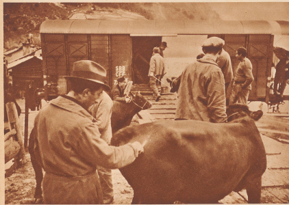
Der gefürchtete «Seuchenwagen» in Sembracher. Der Spezialwagen der SOB, in dem die seuchenkranken Tiere, die zur Notwendigkeit transportiert sind, in die Seramontine nach Basel und Gené spedit werden. Comparable à la charrette du condamné, voici le sinistre «wagon de seume» où les vaches sont embarquées. A Bâle ou à Genève, leur sang sera peut-être fait du sérum et elles seront abattues.