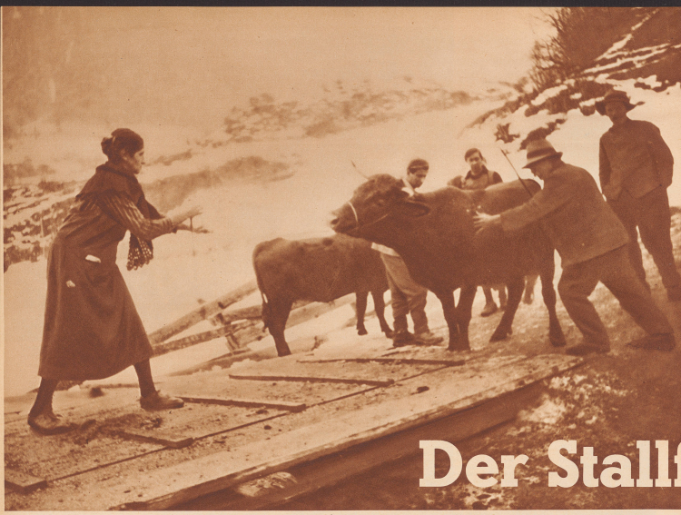
Außerhalb des Dorfes Sembracher ist eine provisorische Range errichtet worden, wo die seuchenkranken Kühe in die Martigny-Ostère-Bahn verladen werden. Nur mit Gewalt sind die Tiere über die Rampe zu bringen, so sie, als ob sie stöhnen, daß sie nicht mehr lange zu leben haben. Que velle dans un pressoirment? Les vaches malades se rebiffent à monter sur la passerelle d'embarquement de chemin de fer «Martigny-Ostère».