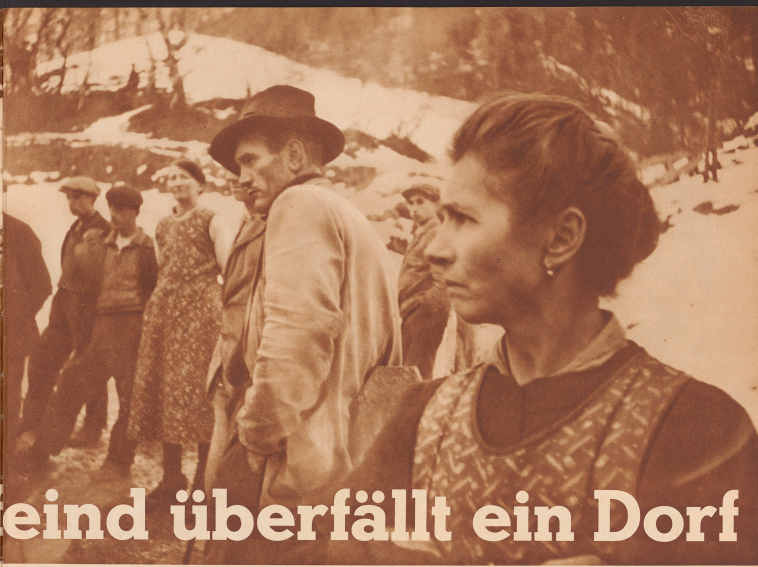
Der 20. Januar war ein ganz schlimmer Tag für die Leute von Sembracher; 16 erkrankte Kühe aus 9 Ställen, die man wochenlang gepflegt hatte und durchsuchen wollte, mußten auf Anordnung des Kantonsarztes abtransportiert werden. Alles Bieres und die Tieren väterchen des armen Bauern sind ihrem Frauen nicht, sie müßten ihre Kühe einfach hergeben. Nicht nur Erlaubnis mit den Tieren, sondern eben auch ein ganz verächtlicher Schmerz über den materiellen Verlust speich aus den betrogen Gesichtern dieser schwer geschädigten Leute. Un jour tragique. L'après-midi on a pu transporter les seize vaches défectives à destination cantonale. Le 20 janvier, les paysans regardaient partir avec tristesse au moins cent cinquante bêtes.

Le 3 décembre 1917, un premier cas de fièvre aphteuse était signalé à Sembracher (Bas-Vallais). Malgré toutes les précautions prises, deux mois plus tard, 96 des 110 étables aux environs du village étaient atteintes; 220 vaches et veaux, 133 chèvres, 140 moutons et 60 porcs devaient être abattus. Le bétail restant ne produisait plus assez de lait pour les besoins de la population. La fièvre aphteuse a cessé au village. Ce drame atteint une population pauvre et laborieuse. Tous les paysans de Sembracher sont de petits propriétaires, possédant quelques chèvres et de 2 à 8 vaches. Quand le mal sera définitivement enrayé, il sera bon que une collecte soit organisée et que chacun donne pour permettre aux habitants de ce village de racheter du bétail.