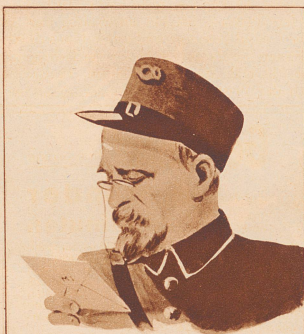
Der Briefträger ist gut Freund mit seinem ganzen Bezirk; er kennt alle und alle kennen ihn.