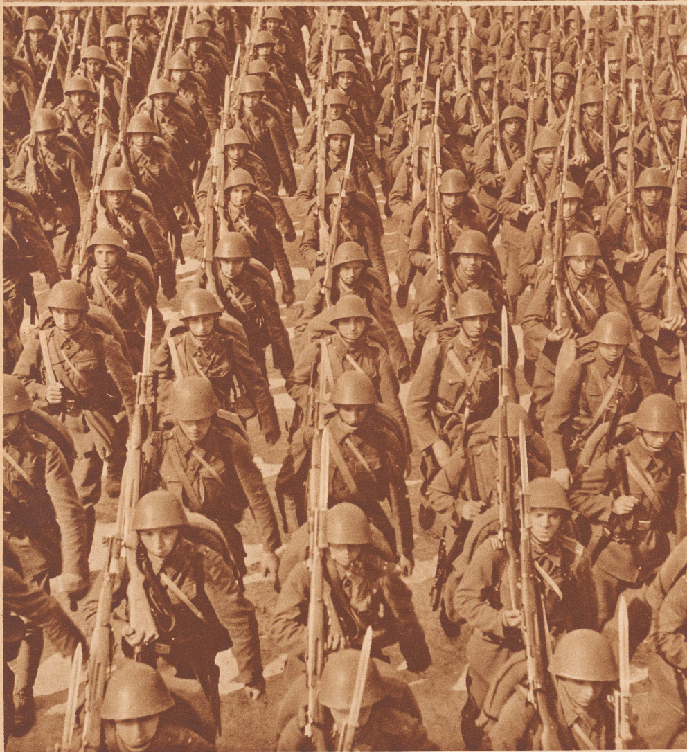
Tschechoslowakische Infanterie auf dem Marsch. — Infanterie tchécoslovaque en marche.