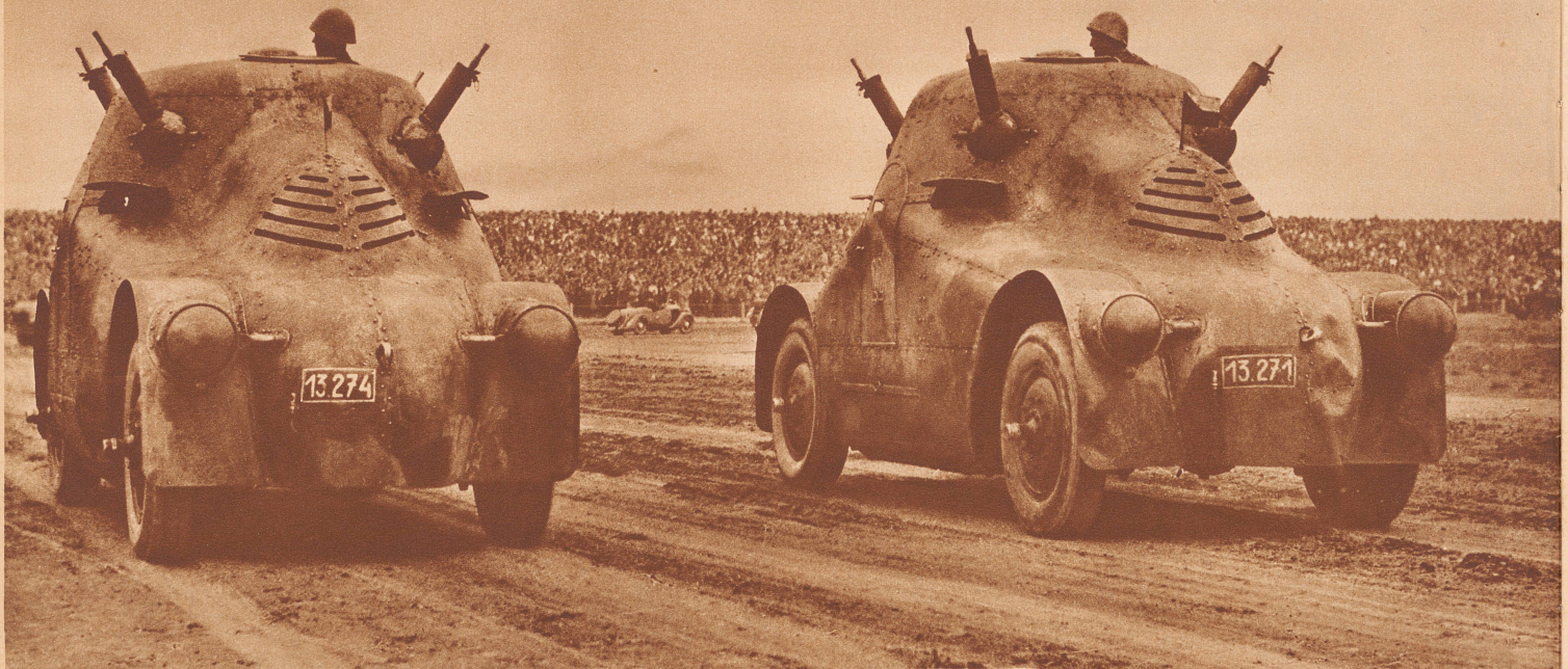
Tschechoslowakische Panzerwagen bei einer Parade in Prag. Chars d'assaut dans une parade de Prague.