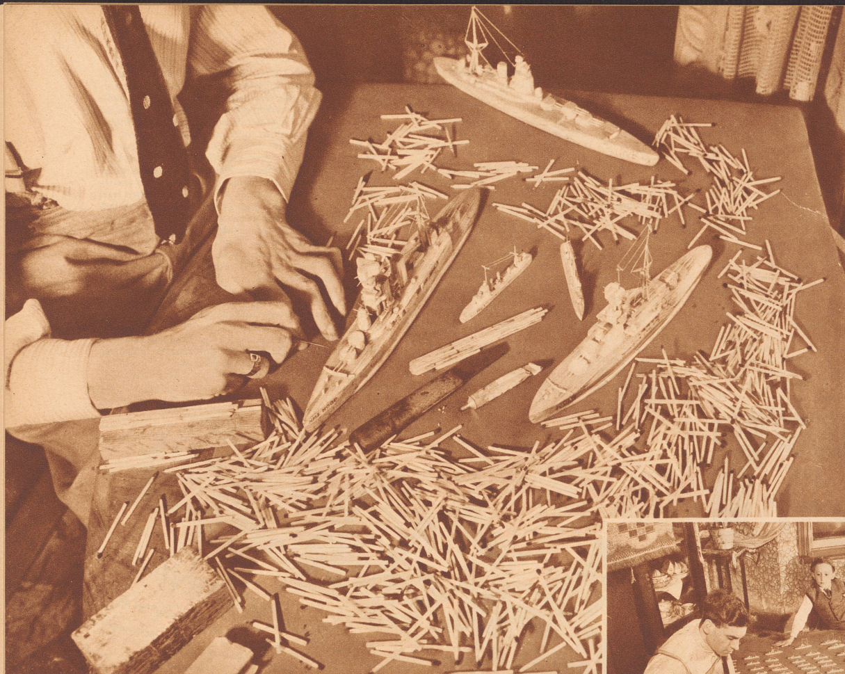
Mit unzähligen gebrauchten Zündhölzern baut der junge Engländer Bert Gibbs große und kleine Schiffe.