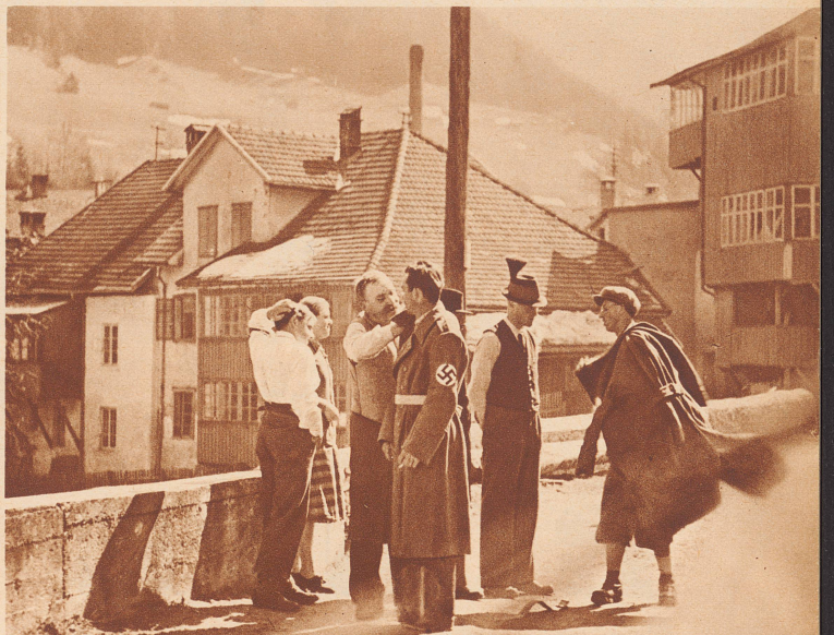
Einkleidung in die neue Partei-Uniform — es ist gut, daß ein Erfahrener dabei ist, der zeigen kann, wie das richtig gemacht wird. (Aufnahme aus Steinach, einem kleinen Ort am Brenner).