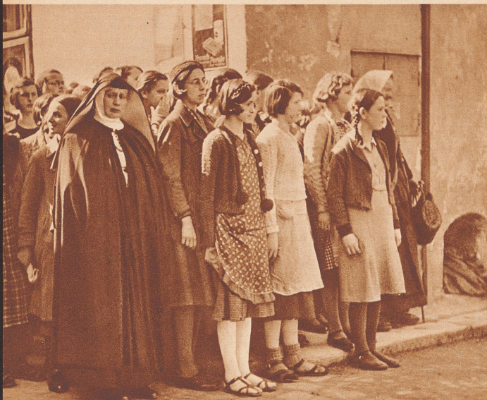
Schülerinnen einer öffentlichen Lehranstalt in Freistadt (Ober-Oesterreich), unter Aufsicht ihrer geistlichen Lehrerin, als Zuschauer ... Sous le regard de leur directrice spirituelle, elles assistent ...