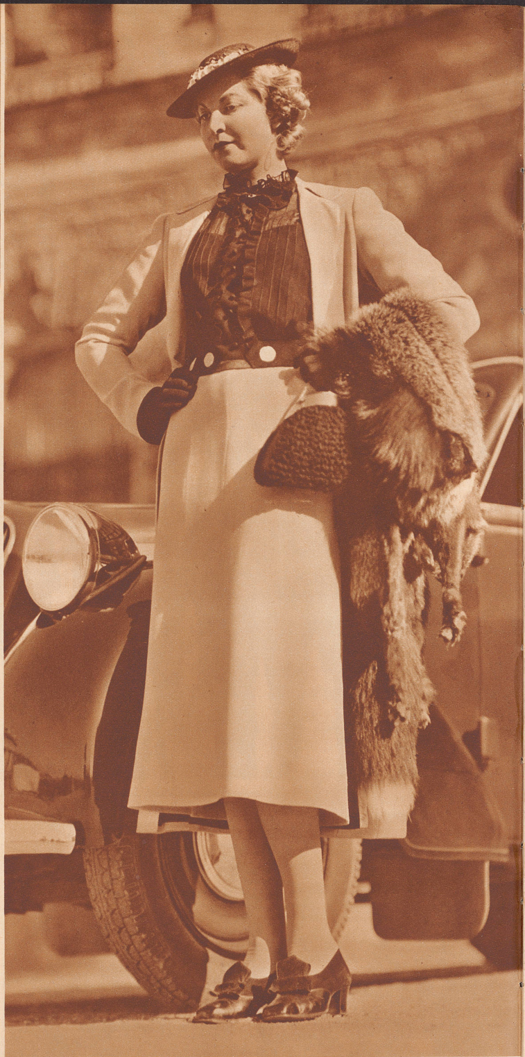
Türkisfarbenes Crêpe de Laine-Complet mit schwarzer Tüllbluse. Modell: Farnhammer, Wien. Tailleur en crêpe de laine turquoise avec blouse de tulle noir.