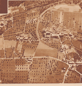
Nr. 21 S. 608

Der Garten des schweizerischen Vaterlands von oben. Wir sind über Fira im Thurgau. Jeder Flieger, idem Flugtag geht hoch über der Erde empor, nie gestaute Schilheit und nie (Hilf) ein Herz schiller schlagen, wenn er die Seiten seines Erdenspiegels ganz anders zu sehen bekommt, als er von unten bei Boden zu sein gewohnt ist. «Quel ordre simple règne sur la terre. Elle est la première impression que nous le paradis de l'air. Puis à mesure que le maître gagne de la hauteur, que la terre se fait plus lointaine, les choses et les gens sont petits. Il est clair maintenant, combien l'homme est un être petit. Il est clair maintenant, combien l'homme est un être petit. Il est clair maintenant, combien l'homme est un être petit. Il est clair maintenant, combien l'homme est un être petit.