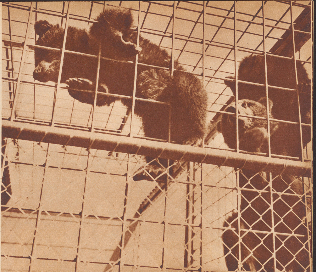
Wenn sie nicht gerade schlafen oder fressen, klettern die drei jungen Bärlü im Zürcher Zoo leidenschaftlich gerne die Gitter hinauf.

Ein «Neffe» oder eine «Nichte» hat dem Unggle Redaktor diese Verse eingeschickt.