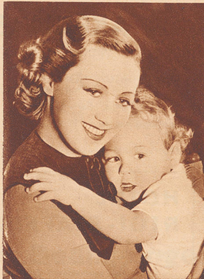
Joan Blondell and her Son Warner Brothers Star appearing in "The Perfect Specimen"

27... Kh7×g7, 28. Sd4—e6+! Schwarz gab auf. Es würde folgen: Kg8, S×f8, K×S, Te6! (Droht D×f5+), Dd7, D×f5+, Df7, D×d5, Tb8, Dd4! Dg7 (Kg8? T×h6!), Df4+, Kg8, Df5! (Droht Tg6 mit Damengewinn), Ld7? Te8+, L×T, T×L+ nebst Matt. Ein fein durchdachtes Schlußspiel des Siegers.