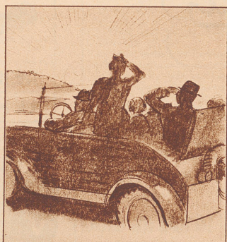
Welch schöner Sonnenuntergang! ... Ja, die ersten Sommertage sind schön, aber am Abend wird es empfindlich kühl.