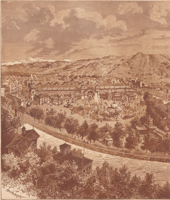
Nr. 30 ZI S. 896

Molzschnitte aus der «Offiziellen Zeitung der Schweizerischen Landesaussstellung»