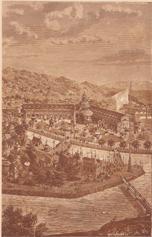
Nr. 30 ZI S. 897