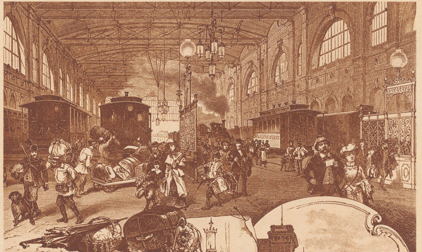
Der Hauptbahnhof Zürich anno 1883

De toute façon qu'il nous soit permis de penser que de cette Exposition résultera pour notre petit pays, les conséquences les plus heureuses, non seulement du point de vue industriel mais encore au point de vue politique et social. Ce n'est point ici une de ces manifestations fédérales où pendant dix jours on exalte l'art du tireur en portant des toasts émus à la Patrie. C'est pendant des mois entiers que pourra se faire l'œuvre de confraternité, et s'il n'y a pas tous les jours à la tribune un orateur chargé de boire à la Patrie, l'Exposition est et demeure un toast vivant efficace qui pendant des mois dira «A la Patrie tous les travailleurs de la main et du cerveau, à la Patrie, tous ceux qui veulent voir briller au premier rang dans le monde, du travail et de l'intelligence».