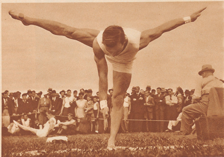
Wädenswil: 4500 Mann arbeiteten am 30. Zürcher Kantonal-Turnfest in Wädenswil. Peinlich aufeinander abgestimmt, beginnt just die stramme Sektion Seebach ihre Riesen am Reck anzusetzen. 4500 gymnastes étaient présents à la Fête cantonale zurichoise à Wädenswil. Cette photo présente la section «Seebach» au reck.