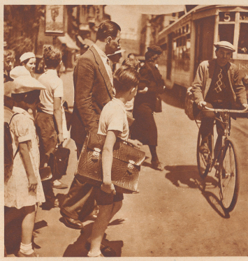
Nr. 31 S. 929

Dans le temple protestant de Milan, un public cosmopolite assiste à la fête des promotions de l'école suisse. Cosmopolite certes, car l'école a bon renom, elle prépare remarquablement les jeunes gens aux grandes écoles et les Italiens distingués ne refusent point à lui confier leurs enfants.