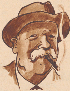
Ein Weber-Stumpfen zum Beschluss Schafft ihm besondern Hochgenuss