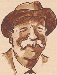
Zufrieden schmunzelt dieser Bauer, Der Handel klappt nach kurzer Dauer.