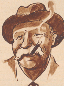
Er raucht ihn gern in vollen Zügen Behaglich und mit viel Vergnügen.