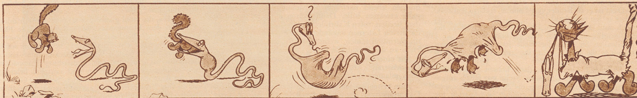
Mizzis Kampf mit dem Drachen. — Le chat et le serpent.