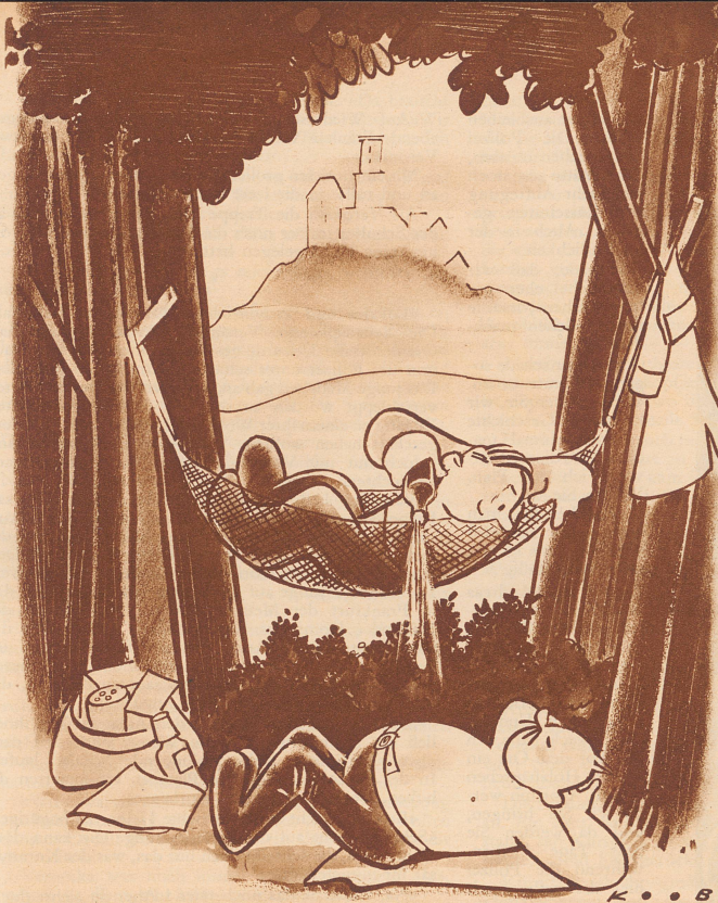
Jetzt wird er gleich von einer Brause träumen.