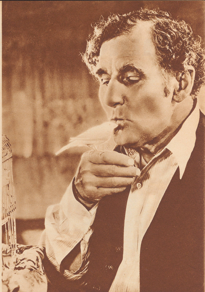
«Buzzie», der Kanarienvogel-Filmstar, mit seinem Spielpartner Fred Stone im Film «Der Farmer in der Schlucht».

Dans les douves du château médiéval de Bodiam (Sussex) poussent des nénuphars par milliers, nénuphars que vont cueillir à la belle saison le gardien du château et ses enfants.