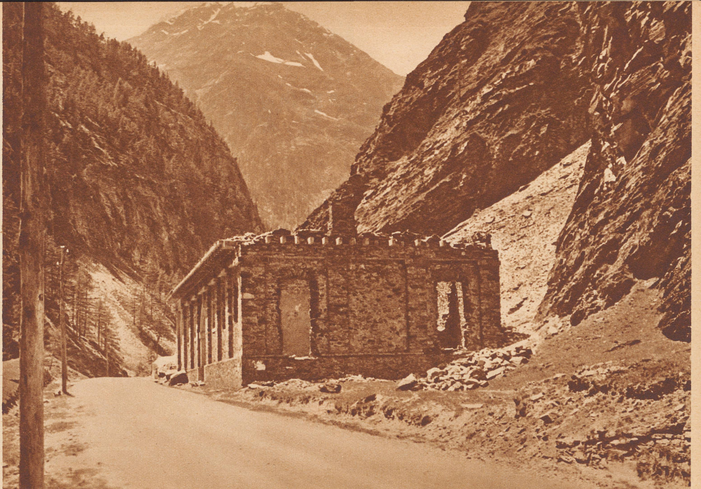
Das ist die halbverfallene Kaserne Napoleons I. an der Simplonstrasse unterhalb Gstein, am Ausgang der Gondoschlucht. Besides, Straße und Kaserne, wurde von Bonaparte ums Jahr 1805 gebaut. Im Hintergrund sehen wir das Fletschhorn.

Ein altes Histörchen heißt folgendermaßen: In einer Ortschaft brennt lichterloh ein Haus. Als eben die Ortsfeuerwehr sich ansammelt, den Flammen zuleibe zu gehen, rasseln auch die freiwilligen Feuerwehren aus der Umgegend heran, um sich an dem Rettungswerk zu beteiligen. Wütend fährt der Kommandant der Ortsfeuerwehr sie an: «Was wollt ihr hier? Da habt ihr nichts zu suchen, das ist unser Feuer!» Es dauert nicht lange, so ist eine allgemeine Prügelei im Gange. Das Haus brennt unterdessen nieder.