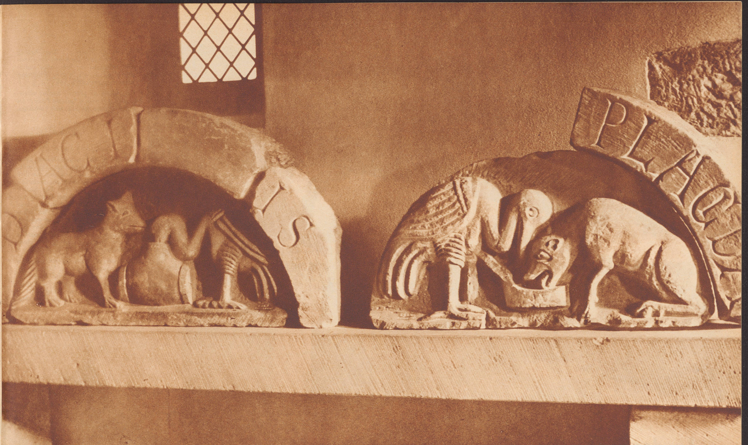
Romanisches Steinrelief aus dem Heimatmuseum Allerheiligen in Schaffhausen, mit zwei Szenen aus der Fabel «Der Fuchs und der Storch». Le thème du Renard et de la Cigogne est postérieur de plusieurs siècles à la fable qu'en tira le bon La Fontaine. Il suffit pour s'en convaincre de contempler ses deux bas-reliefs romans du Musée de tous les Saints à Schaffhouse.