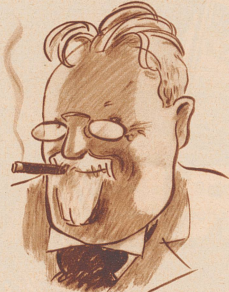
Der Weber-Stumpfen fehlte mir. Das war es. Und jetzt rasch zum Bier.