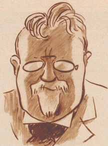
Was war es denn? Was wollte ich? Etwas vergass ich sicherlich.