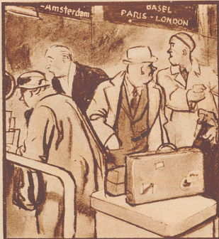
A. „Unerhört! Wieder nur ein Schaller auf, und es zieht!“ B. „Immer mit der Ruhe! Drüben wird der zweite aufgemacht.“