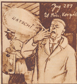
A. „Was? 20 Minuten Verspätung! Mit meinem Herbstkatarrh! Hatschi!“