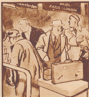
A. „Unerhört! Wieder nur ein Schaller auf, und es zieht!“ B. „Immer mit der Ruhe! Drüben wird der zweite aufgemacht.“