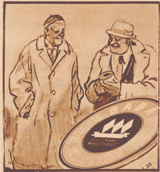
„Ich gehe nie ohne Gaba auf die Reise! Gaba ist die Reiseversicherung gegen Husten und Heiserkeit.“