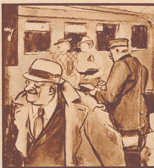
B. „Gesundheit! . . . und Gaba!“