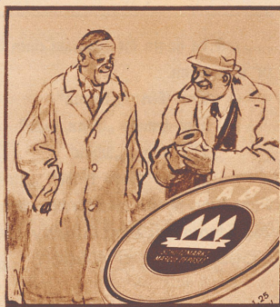
„Ich gehe nie ohne Gaba auf die Reise! Gaba ist die Reiseversicherung gegen Husten und Heiserkeit.“