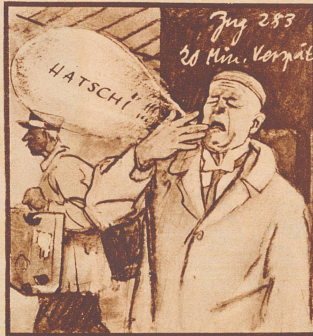
A. „Was? 20 Minuten Verspätung! Mit meinem Herbstkatarrh! Hatschi!“