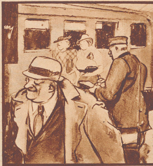
B. „Gesundheit! . . . und Gaba!“