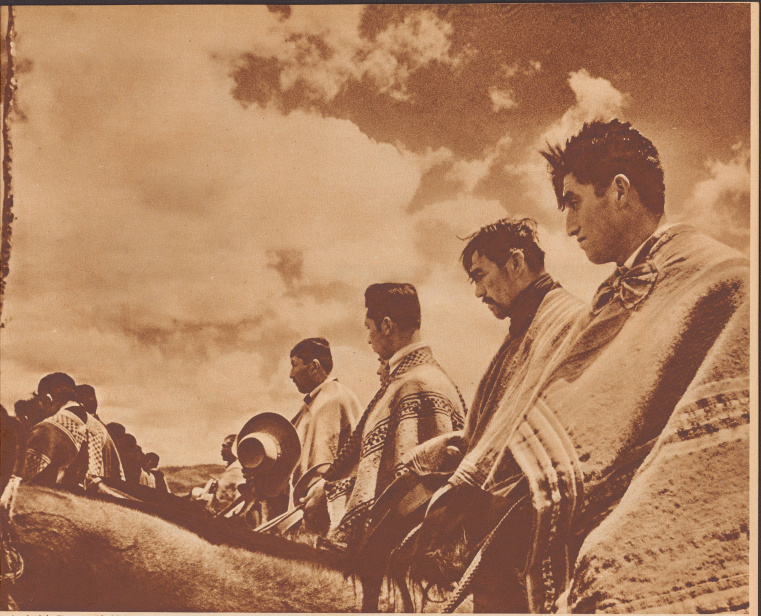
Arakanische Bauern zu Pferd bei einem Frühlingfest in Süd-Chile beten um gute Ernte. Als kleine Reiter kamen die Arakanen eines der Talflüster jenseits der Nordflüsse nach dem heutigen Chile und schufen sich ein großes Reich, das etwa dem Bereich der heutigen Provinz Coquimbo umfaßt. Einige hundert Jahre später aber zogen die weißen Eroberer mit ihren Indianer Verbündeten gegen sie vor und töteten oder vertrieben sie. Ein kleiner Rest des Stammes hat sich überlebt — vorwiegend unbeweglich — der jetzt in einer Art Reservierung von der Landesverwaltung lebt.