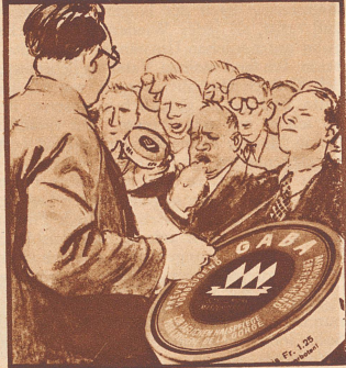
„Meine Herren, denken Sie an den Spruch: Ein kluger Sänger Gaba nimmt, damit es mit der Stimme stimmt.“