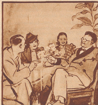
„Und wir haben gehört, daß Sie zum Dirigenten des Gesangvereins gewählt wurden, da dürfen wir noch sehr gratulieren ...“

trieb, war eine tiefe Furcht vor seinem Sproß; wohl ein Schamgefühl, eine tiefere Angst, die in eben jenen Umständen wurzelte, denen der Sohn das Dasein ver- dankte. Nun also, im denkbar schlimmsten Augenblick, gerade während der ausschweifenden Trunkenheit, die das Goldfieber mit sich brachte, stand Johann August der Jüngere plötzlich im Fort und vernahm zu seiner Be- stürzung, daß sein Vater vor kurzem in die Berge gereist sei! Keine Worte könnten die Gefühle, von denen der Jüngling bei seiner Ankunft ergriffen wurde, wahrheits- getreuer wiedergeben, als seine eigenen Bekenntnisse. Offenbar war er von seiner Mutter im Glauben erzogen worden, daß derjenige, den wir Johann nannten, sein Vater sei. Er hatte also vom eigentlichen Wesen seines Erzeugers nicht die leiseste Ahnung, und so war es un- ausbleiblich, daß der Schlag, der dem empfindlichen Jungen bevorstand, lebenslängliche Narben hinterließ. Ueber dieses Wiedersehen berichtet er folgender- maßen: «Ich erreichte Kalifornien im August 1848; das Gold war erst ein paar Wochen vorher entdeckt worden. Schon in Sanfrancisco waren mir sehr sonderbare Be- richte und sich äußerst widersprechende Gerüchte über