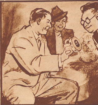
„Sie sollten Gaba verteilen vor dem Singen.“ „Ach, natürlich... daß ich daran nicht selbst gedacht habe!“