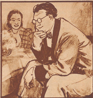
„Hm... vorläufig habe ich noch keine große Freude an dem Chor, nichts als Husten und Räuspern, wir werden ihn umlaufen in „Der heisere Fasan“.“