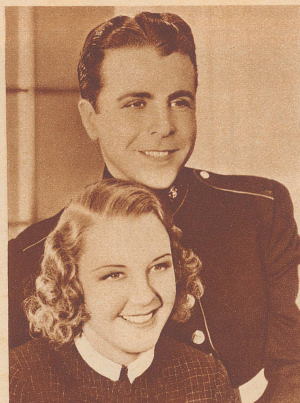
Dick Powell and Doris Weston in The Singing Marine A Warner Brothers Picture