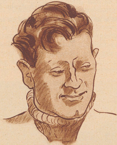
Ein Jüngling sehr gedankenvoll, Er weiss nicht, was er machen soll.