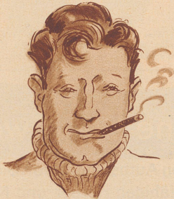
Er zündet einen Stumpen an, Das Beste, was er machen kann.