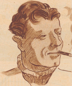
Da hat der Jüngling gleich entdeckt: Ein Weber-Stumpen herrlich schmeckt!