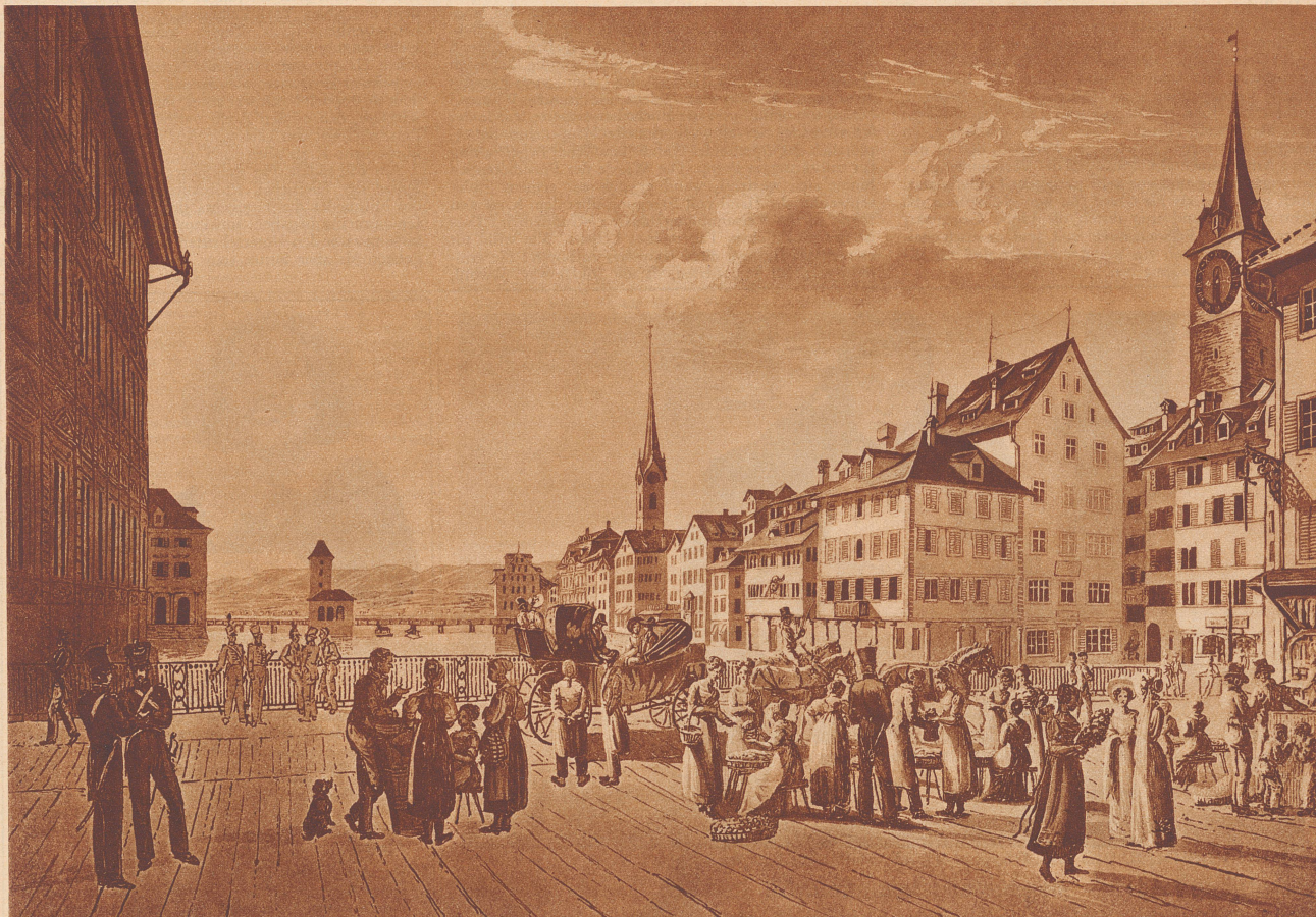
Dessiné par E. Schmid.

Der beste Name für den Hotelneubau am Weinplatz in Zürich?