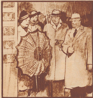
Freys und Flurys können den Heimweg zusammen anretten. Sie wohnen ja Tür an Tür.