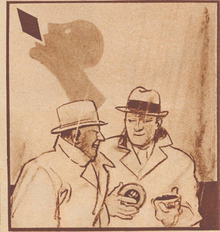
„Der Schirm ist gut, aber mir sind meine Gaba noch wichtiger. Bitte, bedienen Sie sich!“ Ob's windet, regnet oder schneit, Gaba schützt vor Heiserkeit!