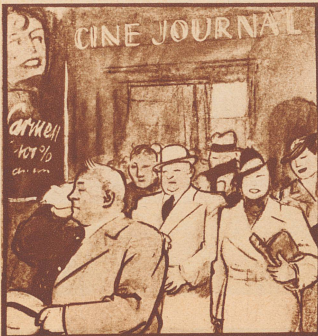
Die Kinobesucher sind noch ganz bekommen von allem Gesehenen und von der Hitze im Saal. Draußen geht ein kaller Regen nieder.

Kurz nach zwei Uhr kamen die Putzfrauen, wir konnten nach Hause, und Meer, der die Sache mit dem Türklinkenstift auf dem Gewissen hatte und sehr stolz darauf war, bekam Klassenprügel.