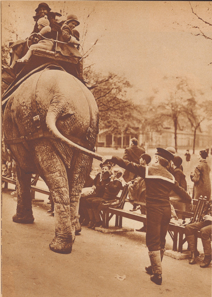
Hier beginnt die Geschichte: Der kleine Seekadett zieht am Schwanz des Elefants... Pour épater ses petits camarades, un jeune cadet de la marine anglaise s'amuse à tirer la queue de l'éléphant du Zoo de Londres. Le pachyderme fait semblant de ne rien remarquer, mais...