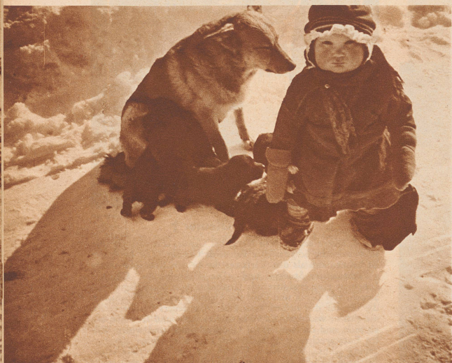
Abhärtung tut not

Le chien de l'escadrille. Avant l'envol d'un bombardier, les pilotes chargent à bord leur mascotte.