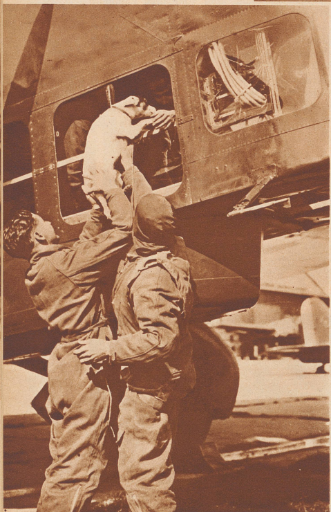
Foxli bringt Leben an Bord

Les chiens-dingos. Dingo est le nom de l'espèce et il ne faut point croire pour cela que ces animaux-là sont fous ou détraqués. Il suffit de relire les contes de Kipling, pour juger de la sagesse de leurs discours.