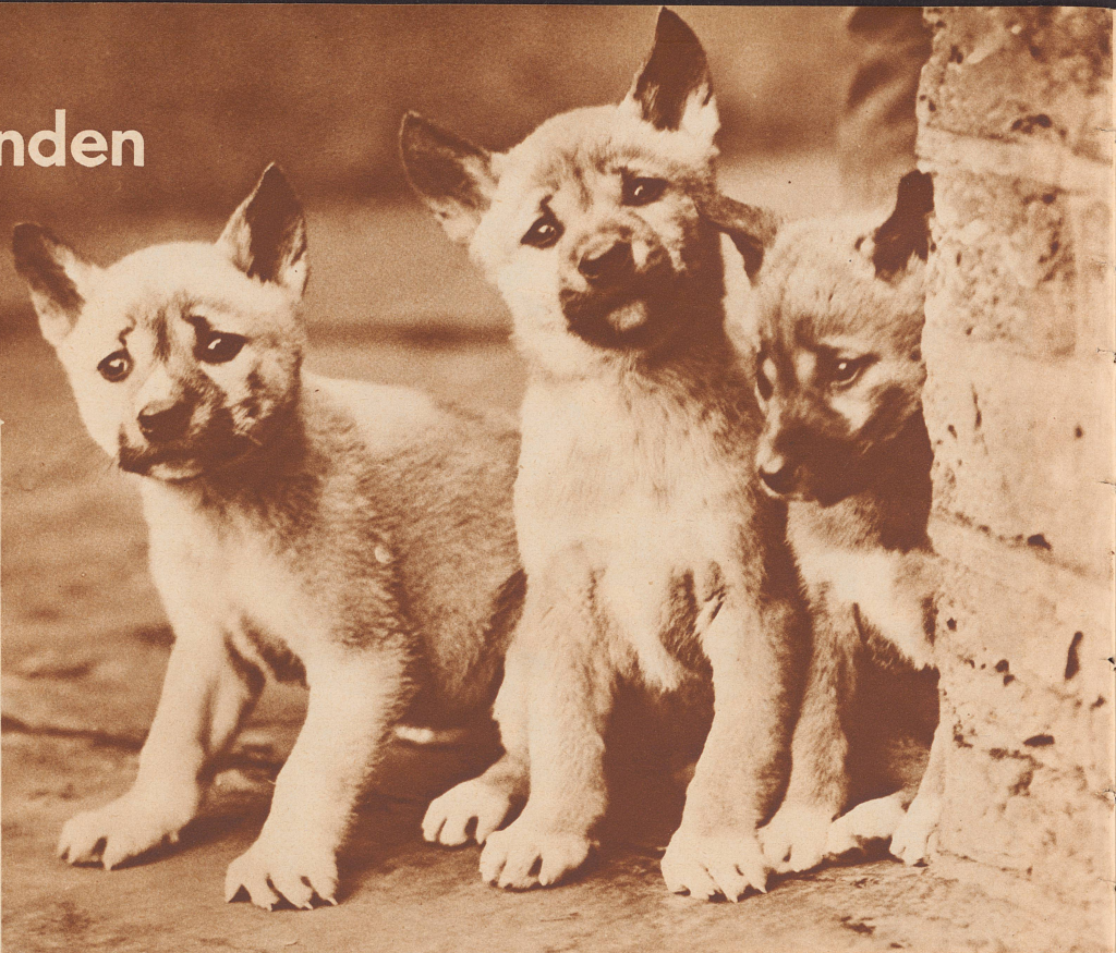
Junge Dingos im Londoner Zoo

Der Dingo ist der wilde Hund Australiens. Was Aussehen und Charaktereigenschaften anbelangt, gleicht er am meisten dem Wolf. Einmal ein gefürchteter Feind der australischen Schafherden, ist er heute fast ganz ausgerottet.