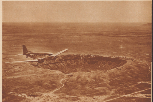
Die Douglas DC-3-Motoren überfliegen einen Meteoritenkrater in Arizona. Survol du cratère d'un météore dans l'Arizona.