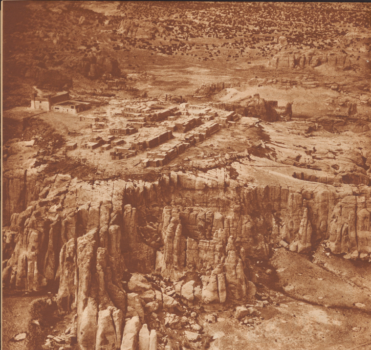
Blick auf die historische Himmelsruhe Acropolis, eine großartige Totstadtanlage, die auf einem 100 Meter hohen, fast unzugänglichen Felsplateau erbaut ist. Caves de pierre sur un plateau de rochers, voici l'antique Acropolis, la cité d'acier du ciel des Indiens.