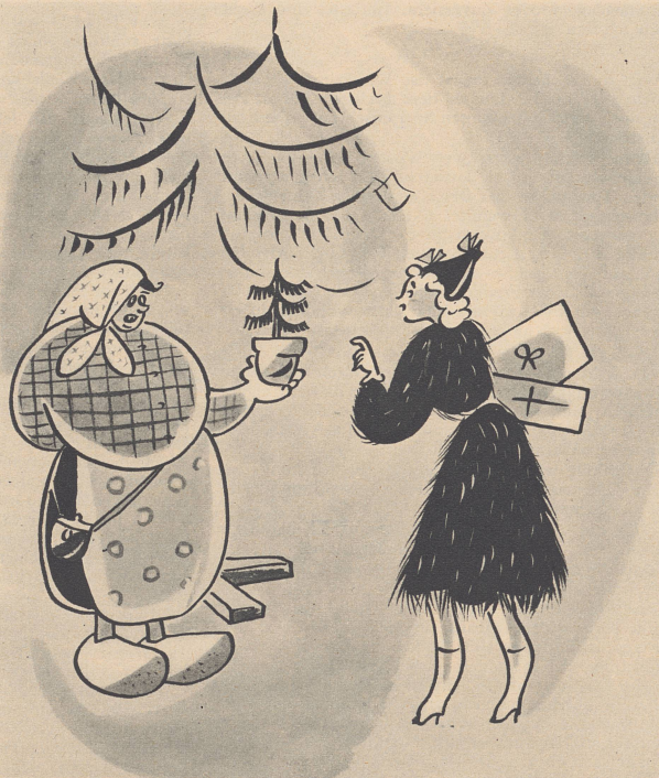
«Was, auch noch zu groß? Dann gehen Sie doch lieber in eine Samenhandlung!»

— Non, je n'ai vraiment pas plus petit. Vous pourriez peut-être voir chez un marchand de graines!