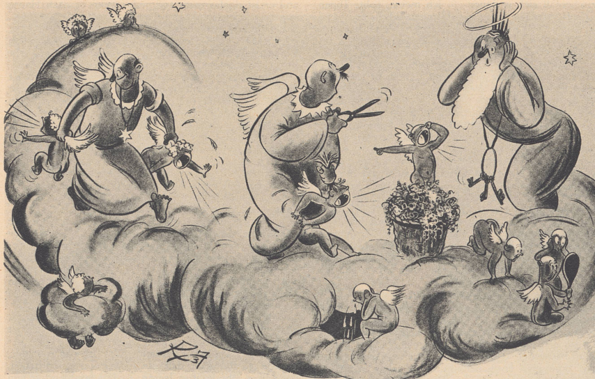
«Es ist ein Mann draußen, der möchte Engelshaar für seinen Christbaum haben...» — C'est ce grand méchant qui veut des cheveux d'ange pour son arbre.