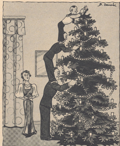
Der Baum wird angezündet in der Familie des Parterre-Akrobaten.

«Ich habe meinem Vater telegraphiert, er soll mir Geld schicken!»