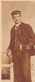
Philipp Etter, 18-jährig, als Student der Städtischen Elementar- und Primerschule Menzingen. Philipp Etter, 18 ans, étudiant à l'école primaire d'Emmetsrieden.

Philipp Etter, 55me conseiller fédéral depuis 1848, est le premier Zouguis qui accède à la plus haute charge exécutive de notre pays. Né le 21 décembre 1891 à Menzingen, Philipp Etter étudia le droit à Zurich, puis, ses études terminées, s'établit à Zug comme avocat. Juge d'instruction en 1917, il était l'an suivant élu député cantonal et, à 31 ans, se voyait élire comme conseiller d'Etat. Landammann de 1927/28, il était élu au Conseil des Etats en 1930. Sa grande compétence et sa parfaite maîtrise le désignèrent comme successeur de Jean-Marie Masay quand celui-ci se retira. Le 27 mars 1934, il était élu au Conseil fédéral, dont il est encore actuellement, avec ses 47 ans, le benjamin d'âge. Au militaire, major d'infanterie. En reconnaissance des grands services qu'il rendit à la cause de l'Empire suisse et de la défense nationale « exclusive », l'Université de Neuchâtel vient de lui décerner le titre de docteur honoris causa.